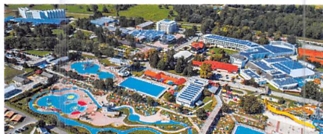
Slika: Terme Čatež - največje slovensko naravno zdravilišče in ena izmed najprivlačnejših turističnih destinacij v Sloveniji