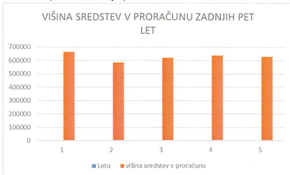
Graf 2: Višina sredstev v proračunu zadnjih pet let