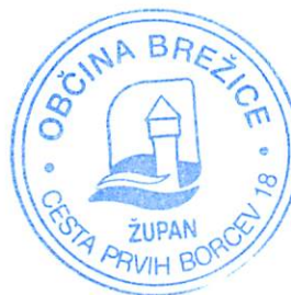
Ivan Molan, župan občine Brežice

Za spremljanje izvajanja letnega programa je pristojen imenovani strokovni svet za področje kulture Občine Brežice.