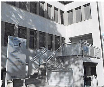
Vhod v SB Brežice