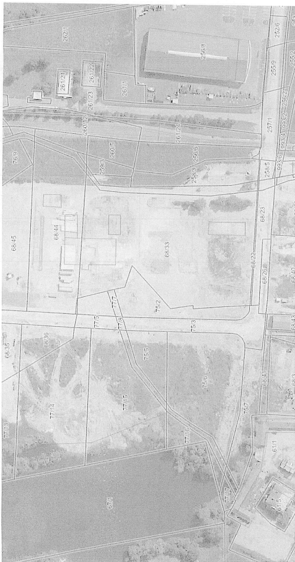
a) Razpolaganje; gradbene parcele v IPC Brezina