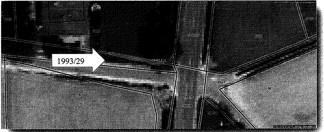
Parc. št. 1993/29 k.o. Nova vas – javno dobro