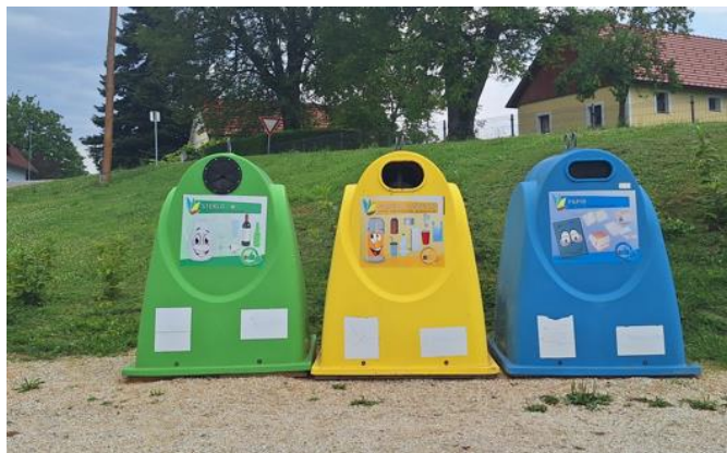
Slika 2: Primer ekološkega otoka v občini Brežice

Na ekoloških otokih zbiramo papir in kartonsko embalažo, stekleno embalažo in odpadno embalažo iz plastike, kovin in sestavljenih materialov.