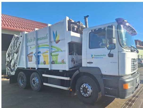
Slika 1: Zbiranje določenih vrst komunalnih odpadkov

Zbiranje odpadkov od vrat do vrat je organizirano za mešane komunalne odpadke, biološke odpadke in odpadno embalažo iz plastike, kovin in sestavljenih materialov in poteka v skladu s koledarjem odvoza odpadkov.