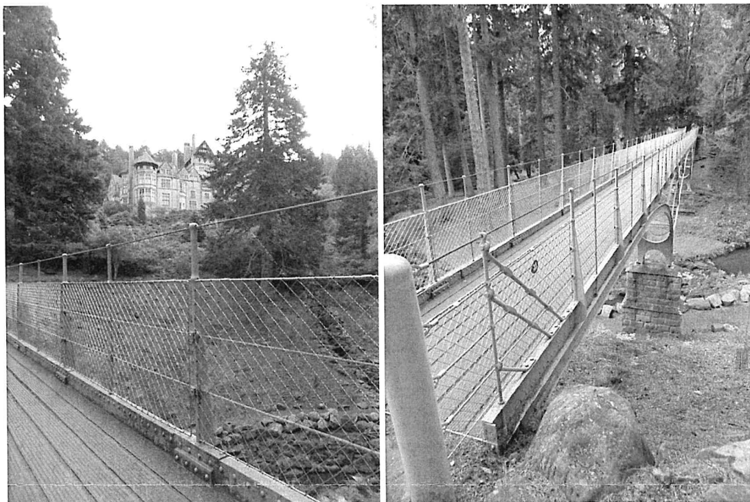
Primer namestitve mreže na ograji mostu (Craggside Bridge, Velika Britanija)

ZVKDS je na podlagi vsega navedenega presodil, da je predlagani poseg investitorja mogoč v obsegu in na način, kot je določen v izreku teh kulturnovarstvenih pogojev.