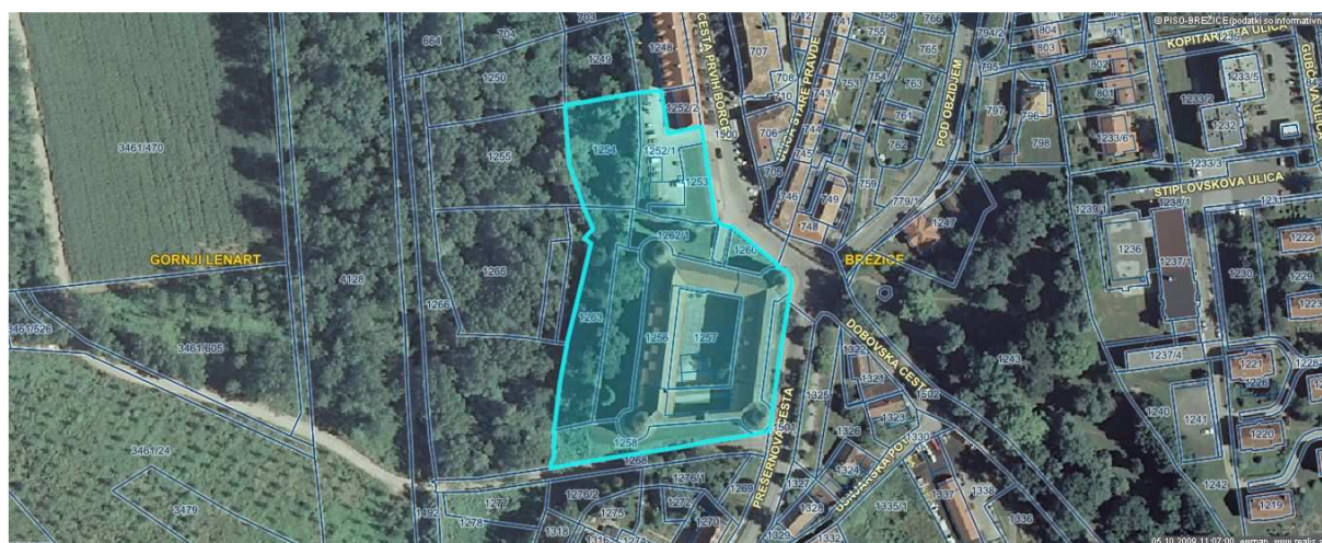
Slika 2: Pogled na lokacijo z oznakami zemljišč