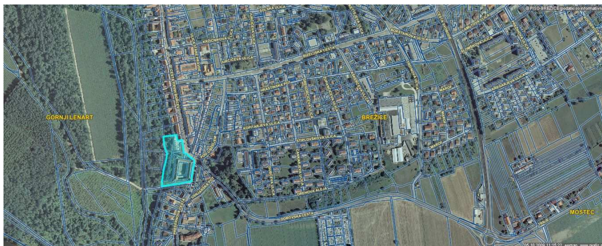
Slika 1: Pogled na lokacijo iz širšega zornega kota mesta