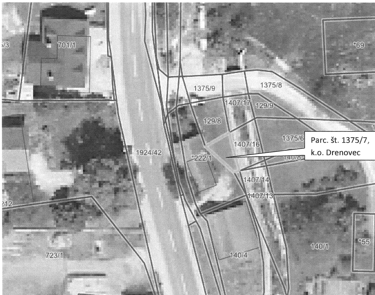
Grafični prikaz nepremičnine parc. št. 1375/7, k.o. Drenovec