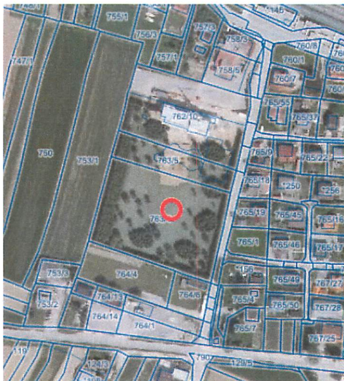
Slika 1: Izsek predmetne parcele na orto foto in DKN