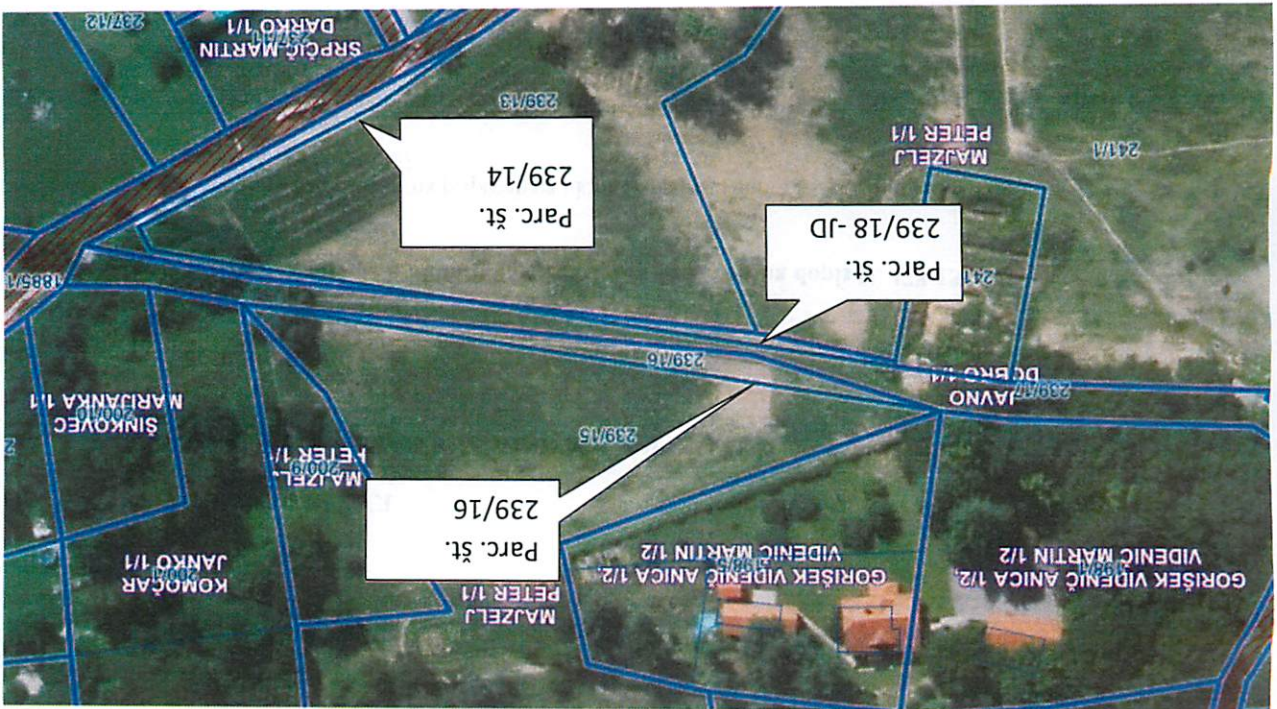
Grafika iz aplikacije PISO: